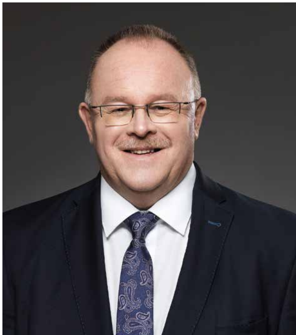
Romain Schneider , Ministre de l'Agriculture, de la Viticulture et du Développement rural, Luxembourg